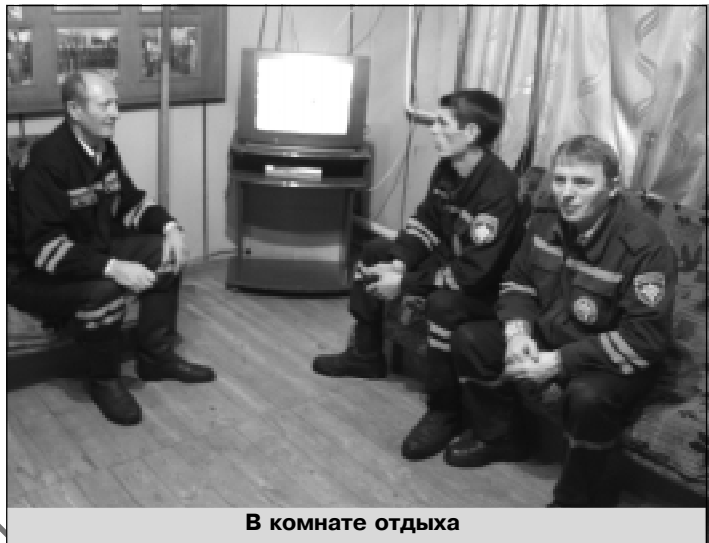
В комнате отдыха

— Анализируя итоги работы службы за прошедшие десять месяцев, следует отметить, что наблюдается сокращение количества пожаров. На сегодня зарегистрировано 30 случаев, в результате которых материальный ущерб составил более 590 тысяч рублей. Но самое главное, на мой взгляд — стало меньше гибнуть в огне людей. Если в прошлом году этот начальный показатель составлял 7 человек, то в текущем — 5. Вместе с тем следует сказать, что увеличилось количество выездов, поскольку дежурные караулы поднимаются по тревоге не только в случае пожаров, но и дорожно-транспортных происшествий, других несчастных ситуаций. Благо, наша спецтехника оборудована всеми необходимыми средствами для оказания людям экстренной помощи. К сожалению,