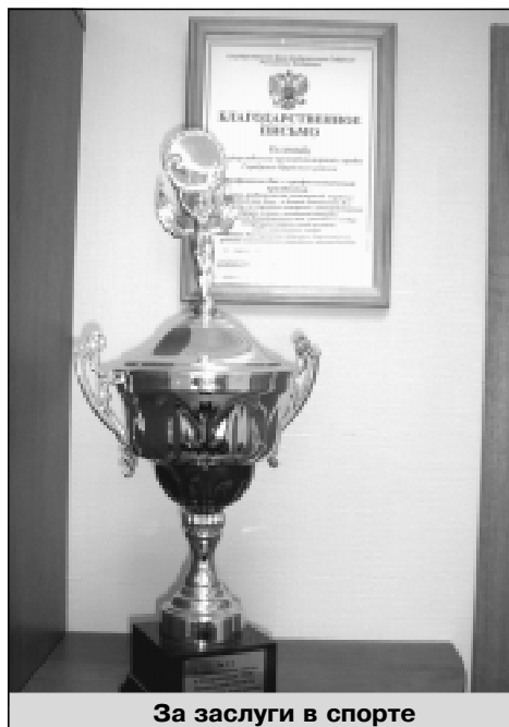
За заслуги в спорте