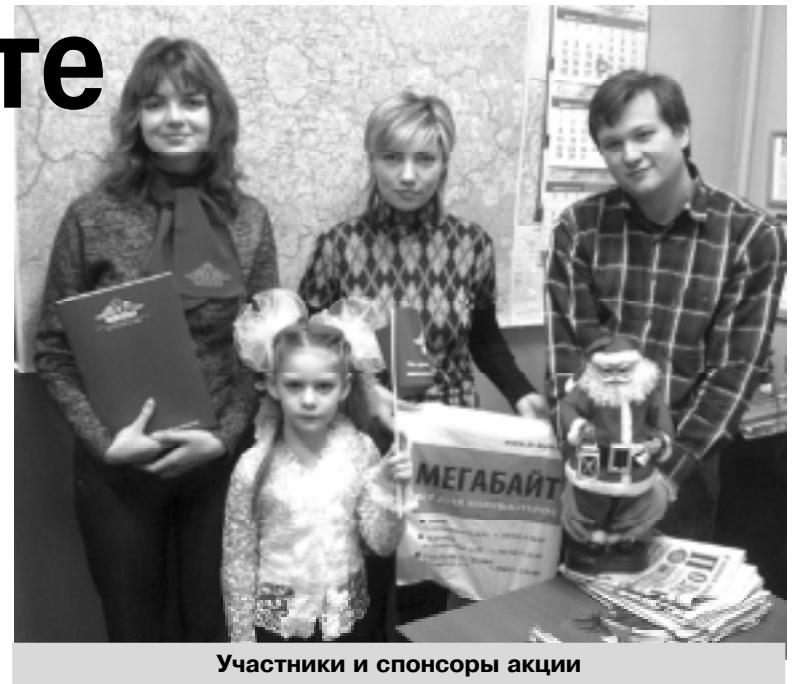
Участники и спонсоры акции

Накануне Нового года редакция «Серебряно-Прудского вестника» организовала розыгрыш призов для читателей, оформивших подписку на весь 2007 год. Спонсорами этой акции стали районный филиал ООО «РГС-Столица», Серебряно-Прудский ликеро-водоч-