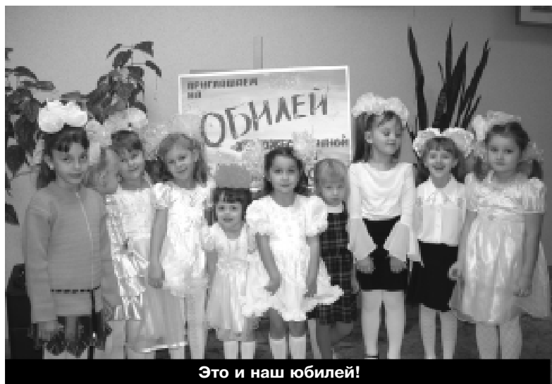
Это и наш юбилей!