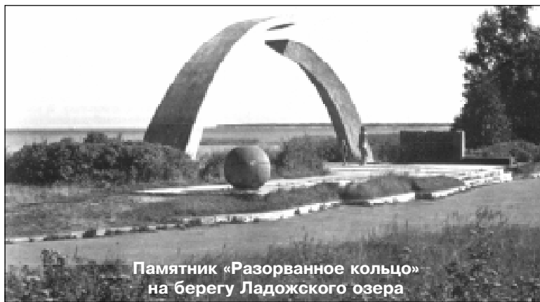
Памятник «Разорванное кольцо» на берегу Ладожского озера