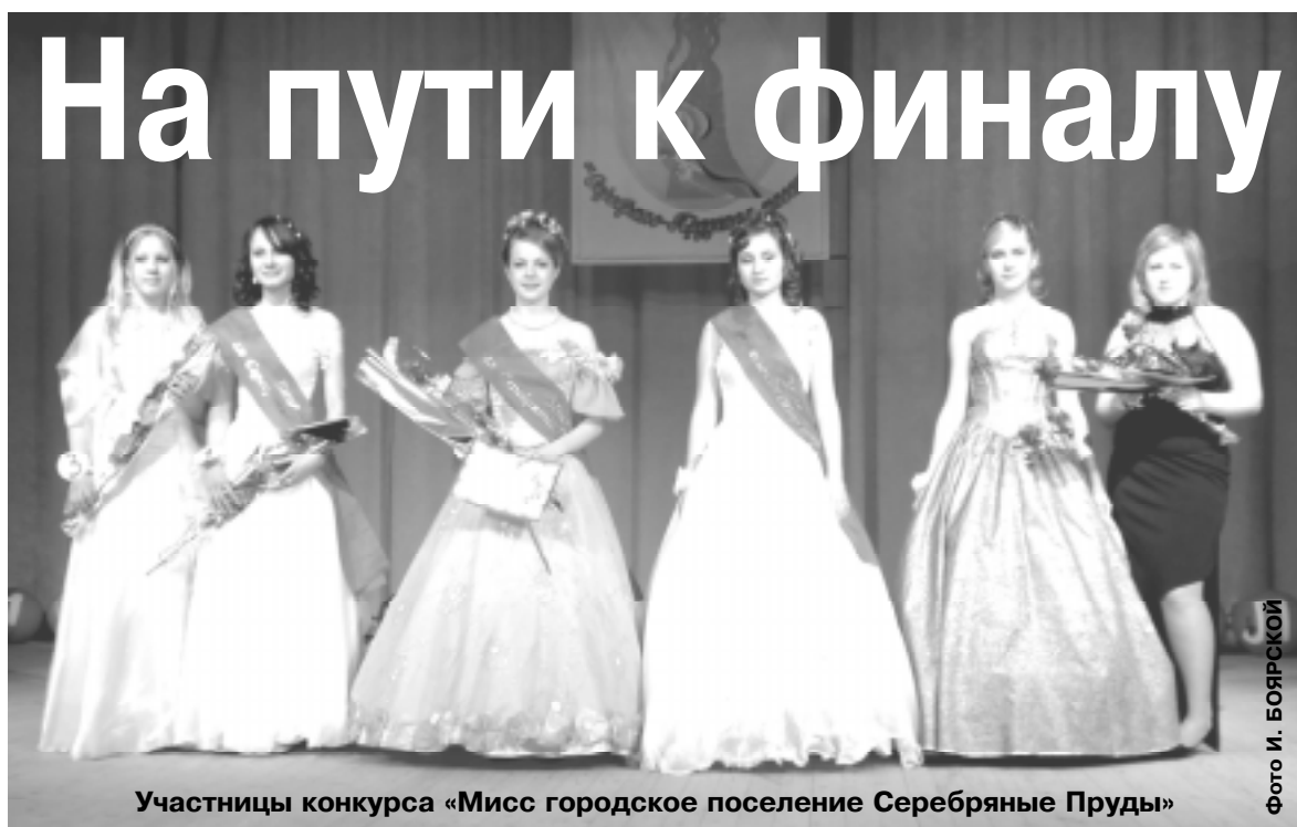
Участницы конкурса «Мисс городское поселение Серебряные Пруды»