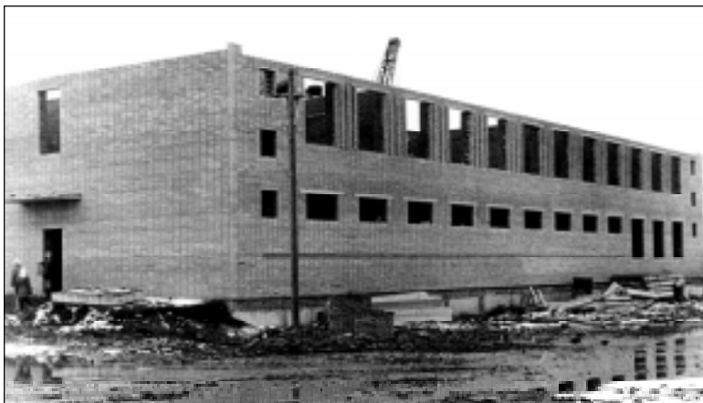
На этой фотографии 25-летней давности запечатлено строительство узла электросвязи. Возведение здания в самом разгаре!