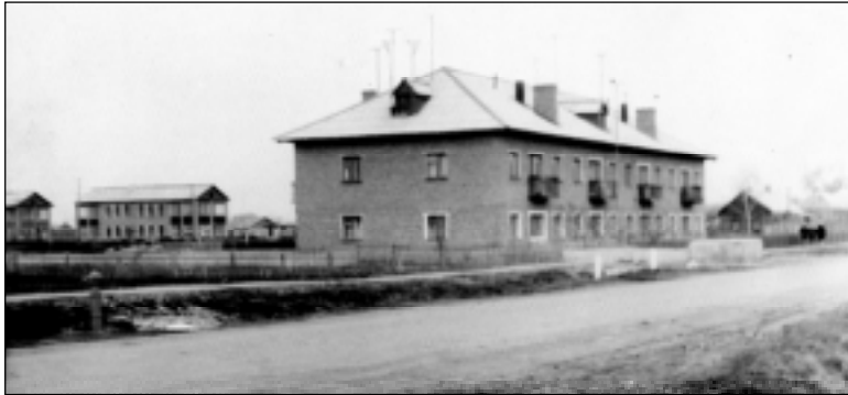
Этот снимок начала 1960-х годов сделан с того места, где сейчас располагается дом № 1 микрорайона Юбилейный. Обратите внимание: слева от нынешнего дома № 8 по улице Первомайской отлично видна улица Школьная, тогда как дома № 10 и районного узла связи в помине нет. Так же, впрочем, как и дома № 6 – вместо него вы видите справа одноэтажную частную застройку.