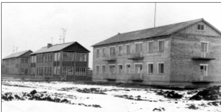
Посмотрите, какой непривычный вид у домов на Школьной улице, особенно у дома № 9. И немудрено: фотография сделана на завершающем этапе его строительства. Рядом с домами нет теннисных садов, да и дорога, сейчас довольно оживленная, на снимке практически не угадывается.