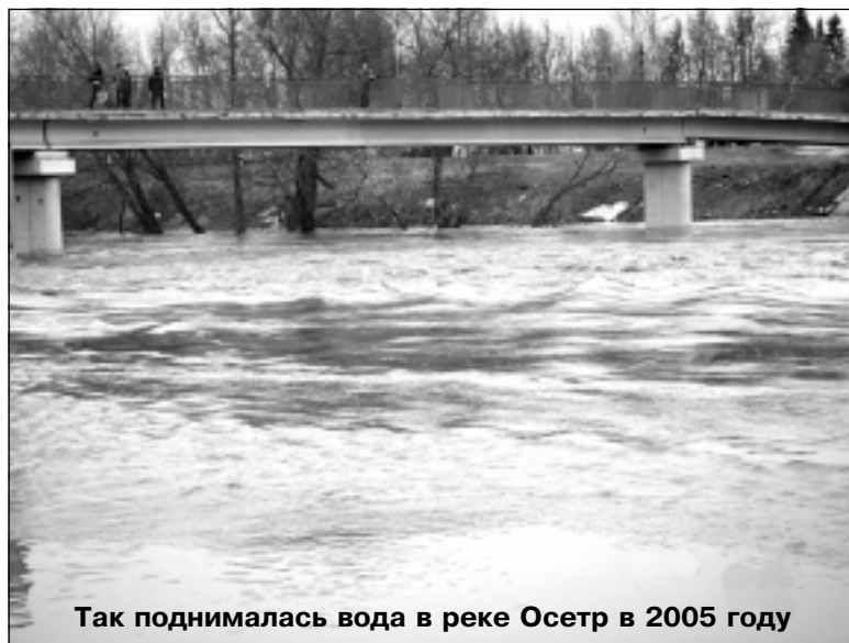
Так поднималась вода в реке Осетр в 2005 году

Последняя зима выдалась не очень суровой, но с обильными снегопадами. Так что, если будет на-