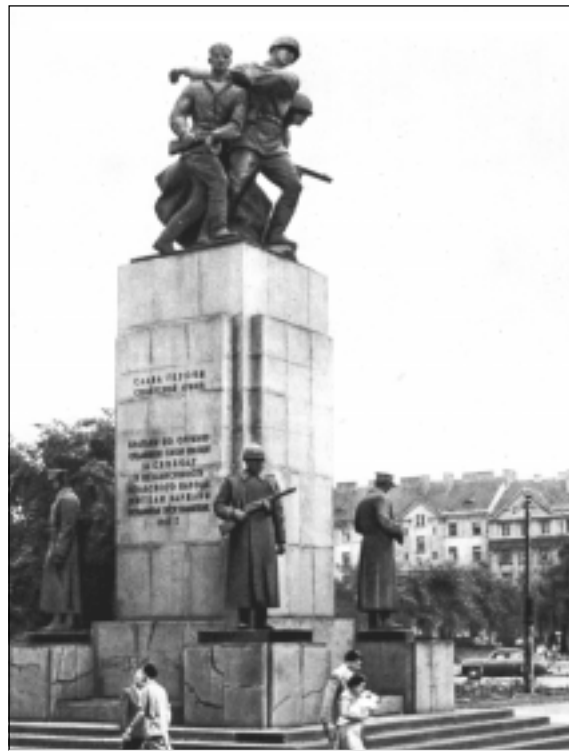
Памятник советским воинам-освободителям в Варшаве

Советское правительство удовлетворило требование поляков. И вот в разгар Сталинградской битвы, когда немцы уже достигли дальних подступов к городу на Волге, когда фронту каждый день и даже час требовались подкрепления, через всю Россию, мимо огненного вала фронта проследовала хорошо оснащенная и обученная армия поляков почти в 100 тысяч бойцов.