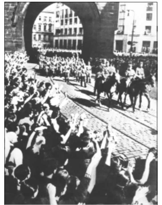
Советские войска входят в Прагу

фронтов. К апрелю 1945 года обстановка сложилась так, что наши 1-й Белорусский и 1-й Украинский фронты, имея генеральной целью Берлин, далеко углубились на Запад. 16 апреля они приступили к штурму Берлина, а 25 апреля 1945