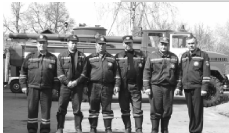
Вот они — огнеборцы!